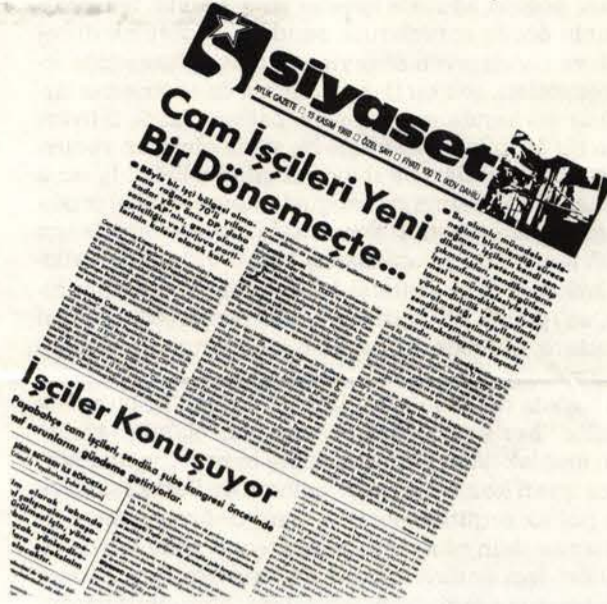
Siyaset 15 Kasım'da çıkardığı özel sayıda da bunları savundu.

En son olarak sendika merkezi Paşabahçe Şube Kongresi'nin toplu sözleşme sürecinden öne alınmasına yönelik bir kararı da çıkartmayı başardı. Nedense, merkez, şubeyi istemiyordu. Paşabahçe'de ise, şube yönetimine muhalif kimi insanların bir kısmı da içinde düpedüz gerici unsurların yer aldığı bir başka muhalif kesim ile birleşerek şube yönetimini, delegelikleri aldı. Bölgecilik, kişisel sürtüşmeler, hızlı kulisler, dar ahbaplık çıkarları sınıf ve kitle sendikacılığı ilkelerinin önüne rahatlıkla geçebiliyor. Bir işçi şöyle diyor: "Şube yönetiminin eksikliklerini biliyoruz, bu eksiklikleri gidermek ve aksamaları değiştirmek hede-